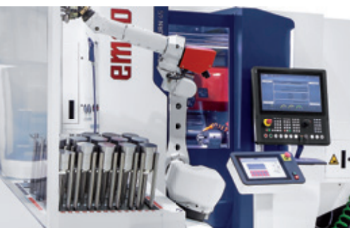
Kompakte, flexible Gesamtlösung: Hyperturn 45 G3 mit Turn-Assist

Kompakter und bedienerfreundlicher als vergleichbare Lösungen – damit ist der Turn-/Mill-Assist für das Bestücken und Entladen von EMCO Dreh- oder Fräsmaschinen am besten charakterisiert. Abhängig von Ihrem Teilespektrum und Losgrößen, können Sie aus verschiedenen Modellen wählen.